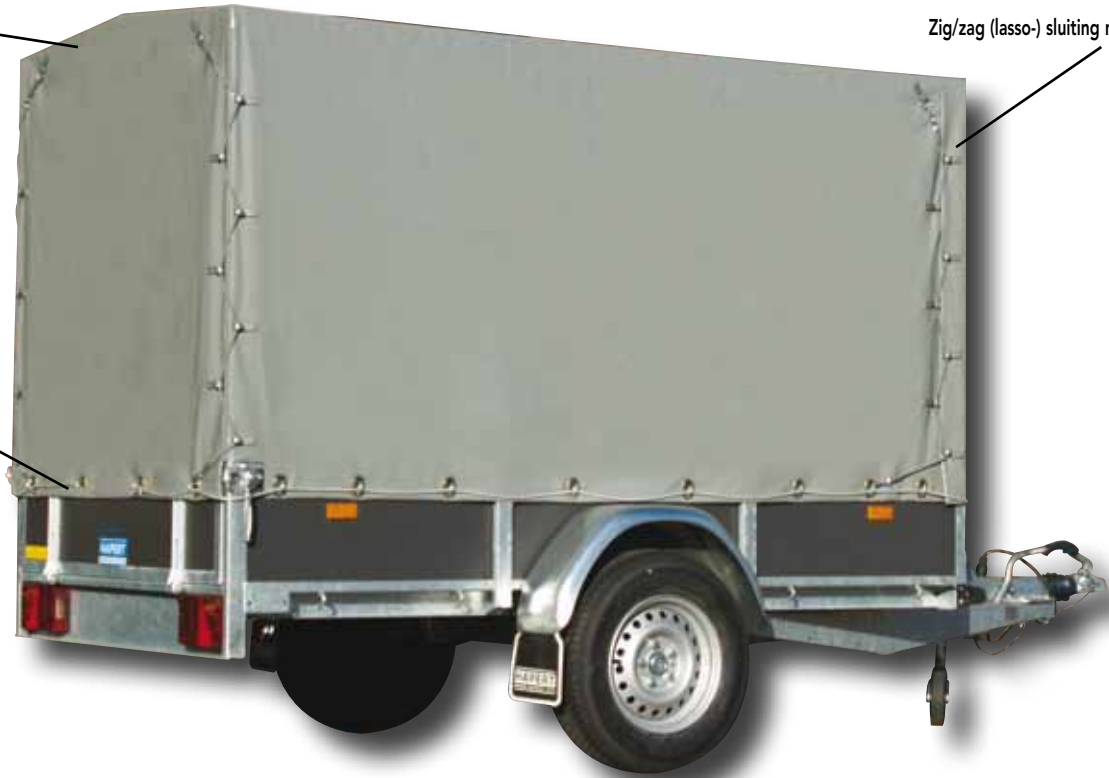
Kunststof, draaibare zeilbeugels (optie: zeilsnoer)

UW LADING IS GOED AFGESCHERMD MET EEN HAPERT-HUIF! Alle HAPERT modellen zijn zowel leverbaar met een vlak zeil (foto 14) als huif. De huiven zijn te verkrijgen in verschillende hoogtes (standaard hoogtes 1200, 1500, 1800 en 2100 mm.), kleuren (grijze kleur is standaard) en uitvoeringen zoals bijvoorbeeld met een achterklep in een vast frame (foto 15 en 16). Standaard is het huif voorzien van een stabiel, afneembaar frame (het dakframe is afgeschuind) en een zeildoek wat 4-zijdig te openen is. Het huif wordt geleverd met kunststof, draaibare zeilbeugels en een elastische zig/zag (lasso-) sluiting van boven naar beneden.